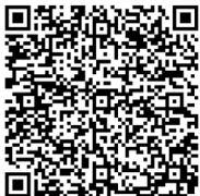
Anfahrt mit Google Maps