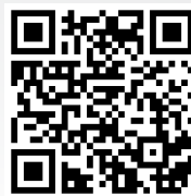
Video: Anfahrt aus der Hafencity