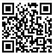
Video: Anfahrt aus dem Centrum